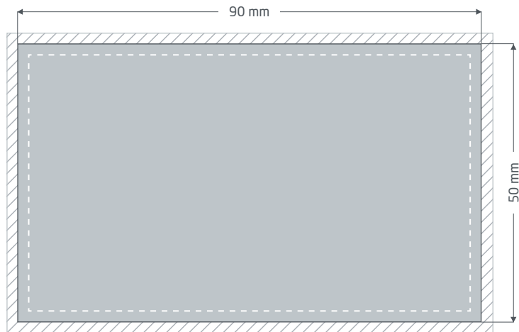
Fronte (pagina 1 PDF)