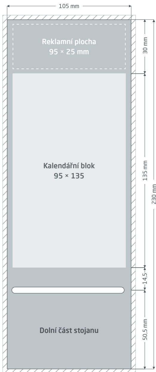
Přední strana (1. strana souboru PDF)