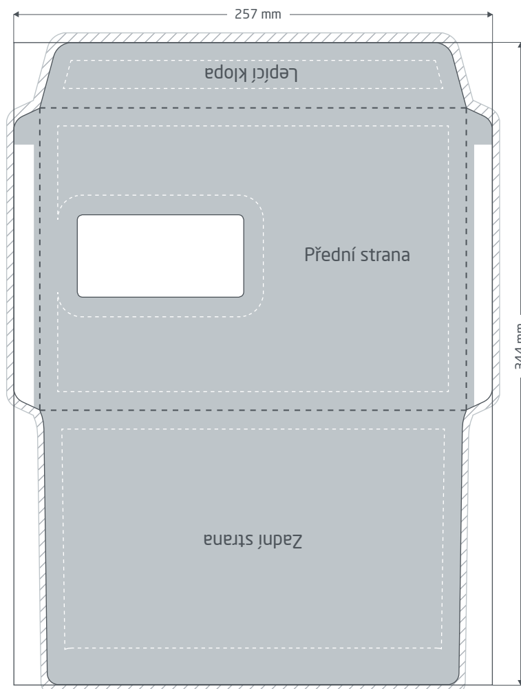
Přední strana (PDF strana 1)